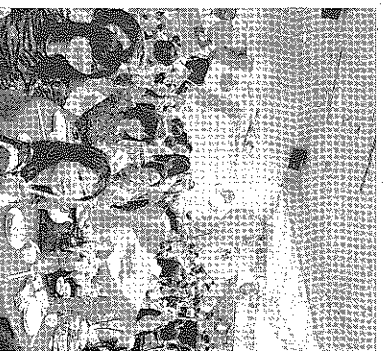
逾 950 個嘉賓出席雙十晚宴

振華聲藝術研究社並定於 10 月 12 時，在該社列治文社址舉行光先師寶誕，並設自助午餐和粵語請電 604-244-1115。